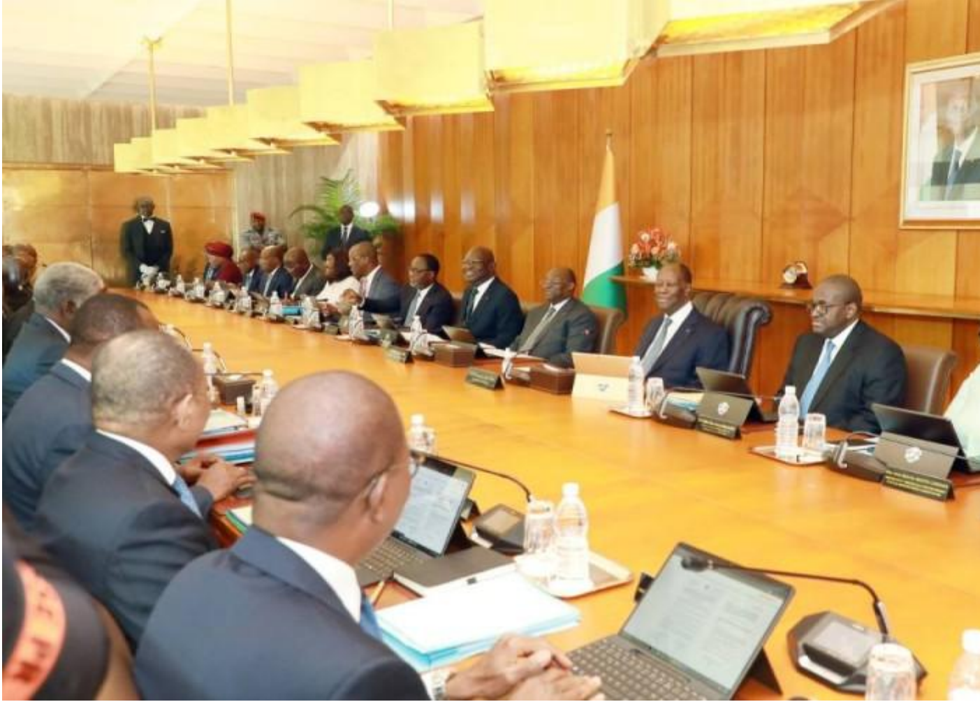
Politique - Le conseil des ministres de ce 1er avril 2026